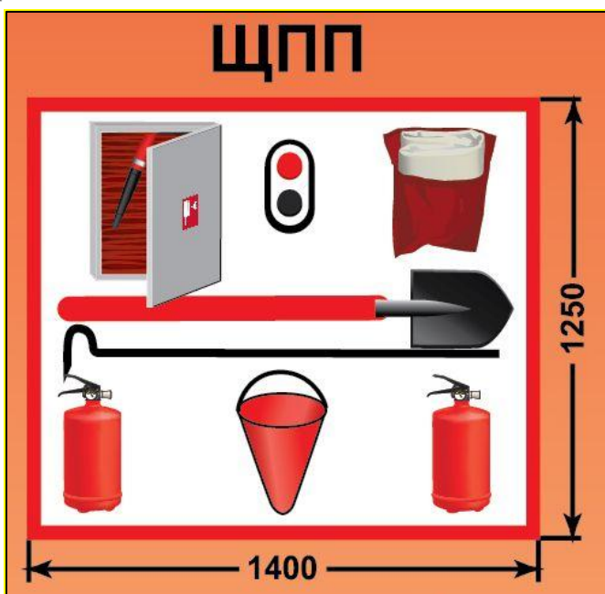
ЩПП – щит пожарный передвижной