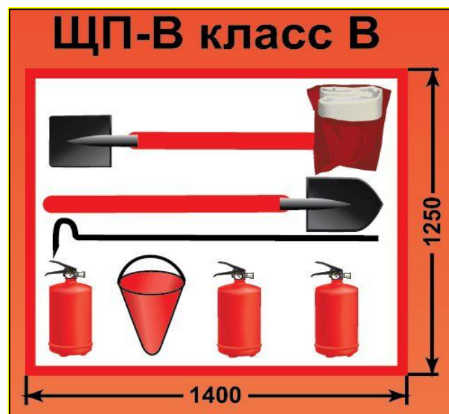
ЩП-В – щит пожарный для очагов пожара класса В