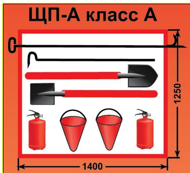
ЩП-А – щит пожарный для очагов пожара класса А